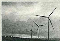
Figura professionale che, padroneggiando competenze su materiali, tecnologie e strumenti tecnici e costruttivi, è in grado di proporre soluzioni per il risparmio energetico su edifici, l'installazione di impianti a energie rinnovabili, le tecniche ambientali, la realizzabilità tecnica ed economica